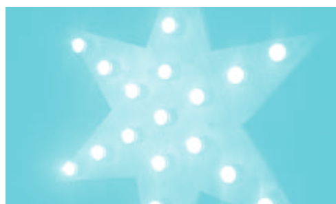
Stern und Foto Sakristan Patrick Stillhart