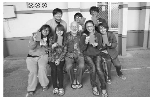
Mit diesen Studierenden hat P. Karl am 7. Februar 2011 am Jugendtag der Ureinwohner teilgenommen. Bei Tanz und Spiel lernen sich Menschen besser kennen.