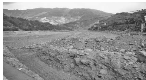
Instandstellung von Strassen, Brücken und Wasserleitungen

Sehr erstaunlich und wunderbar: Der Staat gibt riesige Summen aus für die Instandstellung der Häuser, die Wasser- und Stromversorgung, den Strassen- und Brückenbau.